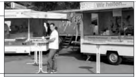
Ruhe vor dem Ansturm.

Sonntagmorgen galt es den Festplatz frühzeitig aufzuräumen, da für 10:00 Uhr ein Gottesdienst mit anschließendem Frühstücken geplant war. Dank des wiederholt engagierten Einsatzes des Koch- und Getränketeams konnten die Besucher zügig bedient und zufrieden gestellt werden. Der letzte Festtag – Montag - begann regnerisch,