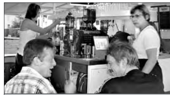
Bei den Festen der ASB-Mainspitze herrscht immer gute Stimmung. Engagierte Helferinnen und Helfer kümmern sich um die Gäste.