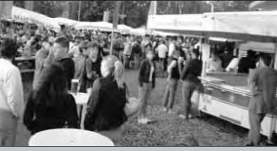
Beliebter Treffpunkt auf dem Burgfest.